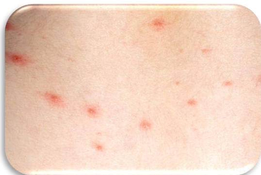
Ветряная оспа начинается с красной сыпи.